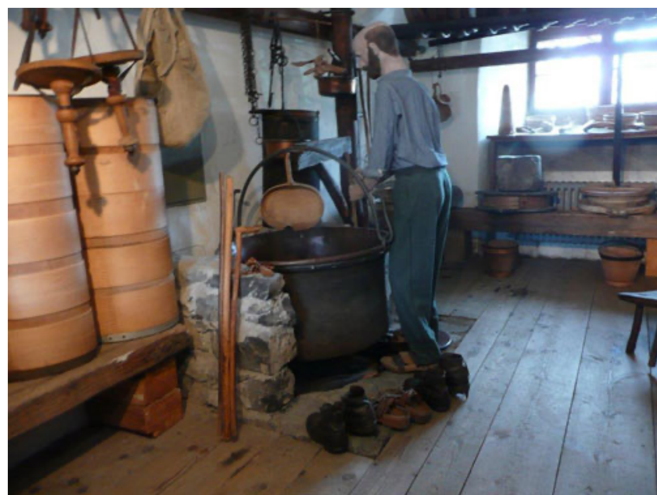
Sennerei im Museum

Auf dem geführten Rundgang durch den Freulerpalast in zwei Gruppen erhielten wir auch einen guten Einblick in reichhaltige kultur- und industriegeschichtliche Sammlung des Museums. Prominent vertreten ist auch die Konfessionsgeschichte des Standes Glarus. Die Näfeler blieben in der Reformation katholisch, das Dorf galt darum als politisches Gegengewicht zum reformierten Glarus.