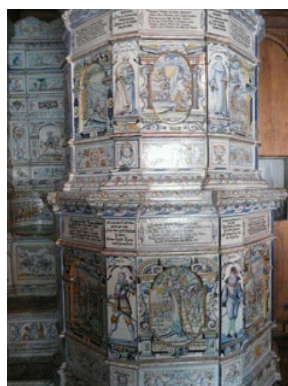
Turmhofen Kaspar Freuler